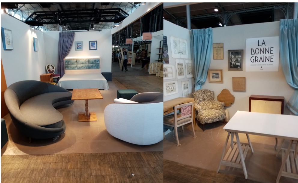
Vue du stand du Label ATF ET VUE DU « METIER » en partenariat avec le CFA de la Bonne Graine lors de la mise en place. Salon Arts et décoration 8 mars 2020

La quasi absence de visiteurs et de réalisation de ventes ont conduit la Profession à ne pas facturer la quote-part de la location des stands aux participants et de prendre intégralement en charge le coût de ceux-ci dans le cadre des conséquences de la crise sanitaire et de l'aide aux entreprises. Ce soutien aux entreprises constitue un manque une perte de ressources de 10 000 € HT.