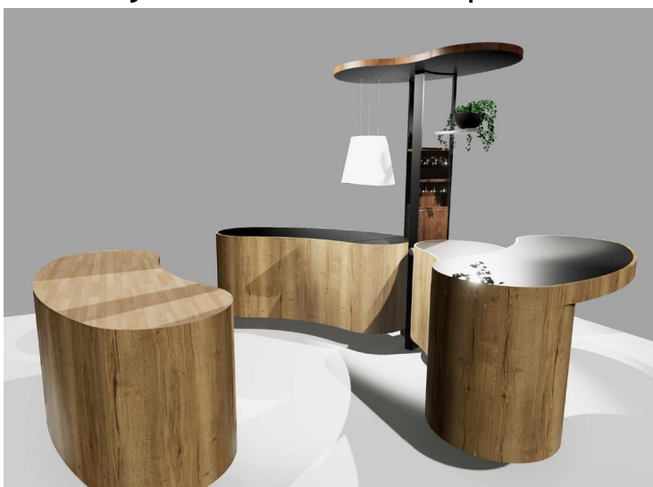
Figure 1 CUISINE COCOON- réalisée par le groupe d'artisans de Vendée. Projet de cuisine entrant dans la catégorie « luxe ». le concept repose sur la réintroduction du mobilier dans l'univers de la